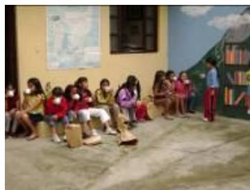
Disfrutando un rico atole con su casco de Astronauta en la Mano

En julio se realizaron actividades sobre El Universo, Los Planetas, Las Plantas, la Fotosíntesis, Ecosistema y las diferentes Medidas que hay.