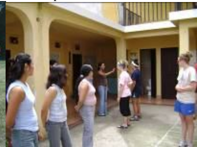
Grupo DWC enseñando a maestras

Airline Ambassadors, nos visitaron el 29 de julio, compartieron con los niños e intercambiaron en la actividad sobre las partes de la oración como el artículo, verbo y sustantivo. Luego dieron víveres a personas de escasos recursos.