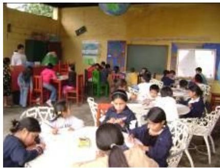
Realizando hojas de trabajo

Les saludamos desde el Centro de Aprendizaje de Biblioteca Ventanas Abiertas. Deseamos que cada día logren los objetivos que se proponen.