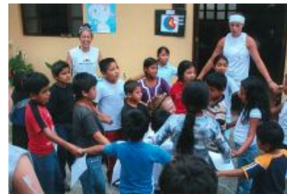
Experimentando movimiento del Universo

Realizaron móviles del Universo, hicieron su casco de astronauta, entre otras actividades que les permitió captar el funcionamiento de nuestro sistema solar.