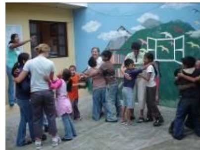
Intercambio con Airline Ambassadors

Airline Ambassadors, nos visitaron el 29 de julio, compartieron con los niños e intercambiaron en la actividad sobre las partes de la oración como el artículo, verbo y sustantivo. Luego dieron víveres a personas de escasos recursos.