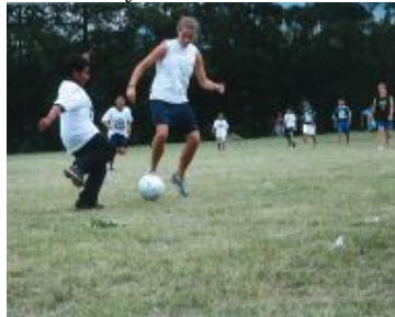
Grupo DWC jugando Fútbol