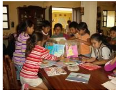
Alegria por recibir libros nuevos

Finalmente estamos todos felices de las actividades realizadas en este mes y que los objetivos para este año se vayan cumpliendo, así que seguiremos reportando nuestros progresos, éxitos y dificultades. Les agradecemos el participar con nosotros de este proyecto.