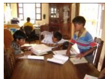
Niños de San Juan Alotenango

Cada día son más los que acuden a la biblioteca. Un grupo de niños de San Juan Alotenango vino a la biblioteca a investigar porque en su municipio no encontraron lo que necesitaban. Esto nos impulsa a mejorar cada día para brindar servicios a más municipios vecinos y así contribuir a la educación del país.