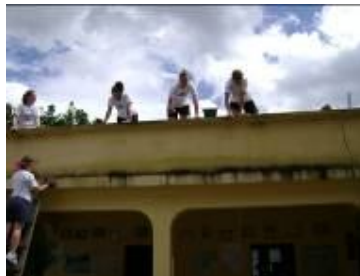
DWC trabajando en área de Biblioteca

Grupo de Canadá DWC. Estuvo una semana, en la que tuvieron la oportunidad de compartir con los niños que asisten a la biblioteca en las diferentes actividades, pintaron la Escuela Urbana Mixta No. 2, las instalaciones de la Biblioteca, visitaron una panadería donde pudieron hacer pan, visitaron una alfarería y realizaron macetas de barro. Arreglaron la casita de un anciano, regalaron un andador a un niño especial que tiene dos años y entrenaron con el equipo de Fútbol de la biblioteca. También enseñaron dinámicas a las maestras de la biblioteca.