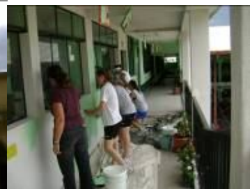
DWC pintando Escuela Pública