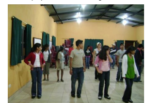
¡En clases de baile!