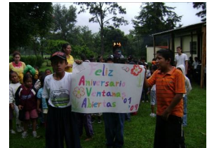
¡Antorcha de aniversario!

El 30 de septiembre dio inicio el programa de jóvenes. Tenemos una participación de alrededor de 20 jóvenes que asisten los lunes, miércoles y viernes de 18:30 a 21:00 hrs. Reciben clases de inglés, clases de guitarra, baile de salsa y merengue, y realizan actividades recreativas, manualidades y juegos de mesa como ajedrez. También han recibido charlas sobre liderazgo, autoestima, han visto películas donde se han creado debates sobre el tema central de la misma, con el fin de despertar su sentido crítico.