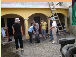
Preparando para el jardín