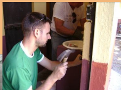
Arreglando baños de la Escuela