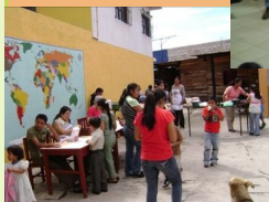
¡En la Kermesse!