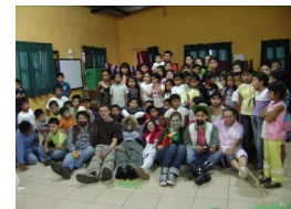
¡Celebración Día del Niño!