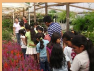
¡Visitando viveros de flores!