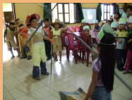
¡Jugando Twister de Símbolos Patrios!